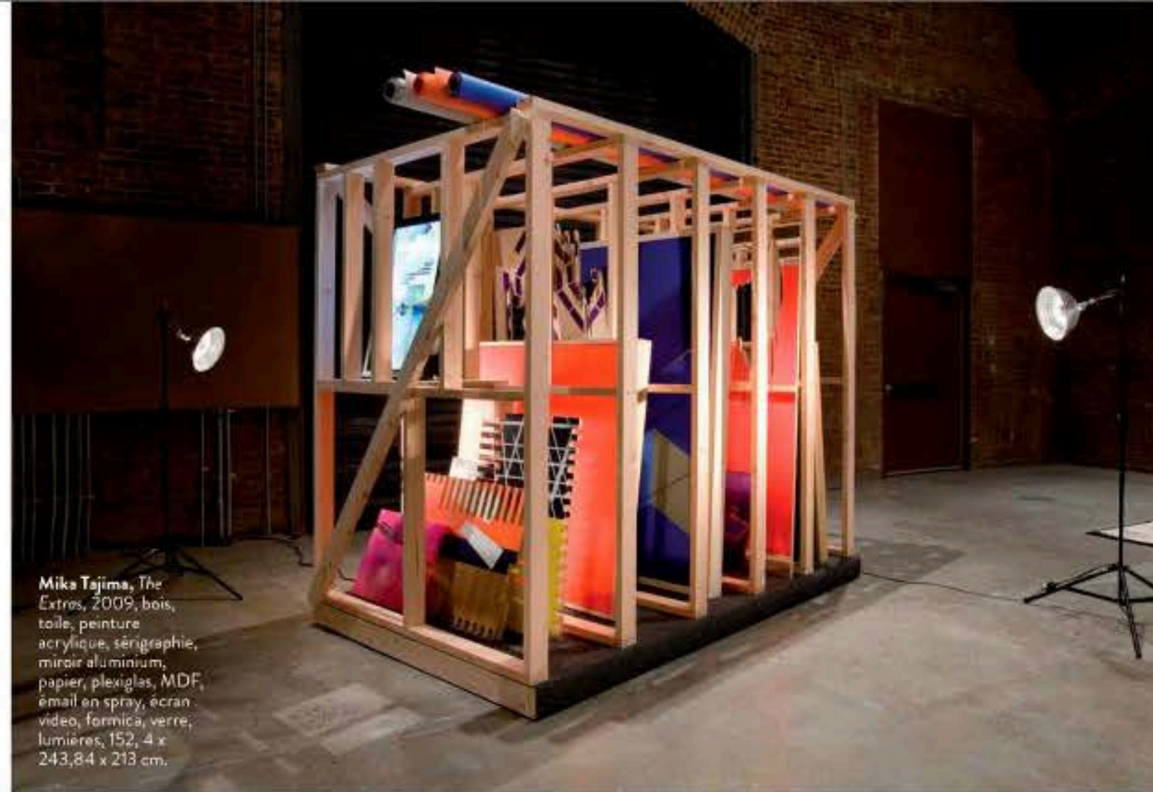
Mika Tajima, The Extros , 2009, bois, toile, peinture acrylique, sérigraphie, miroir aluminium, papier, plexiglas, MDF, émail en spray, écran vidéo, formica, verre, lumières, 152,4 x 243,84 x 213 cm.

Quelles ont été les premières personnes à travailler pour vous ? J'aime travailler ensemble séparément.